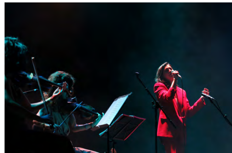
MERCAT DE MUSICA VIVA DE VIC