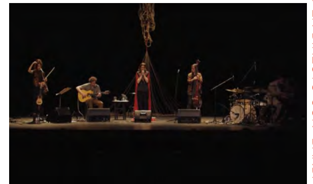
COLLARCICO DE ORO