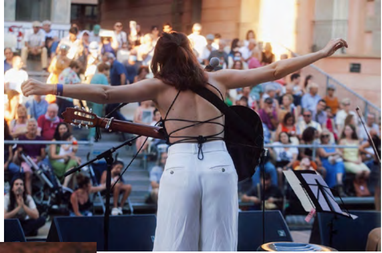
LA MAR DE MÚSICAS (CARTAGENA)