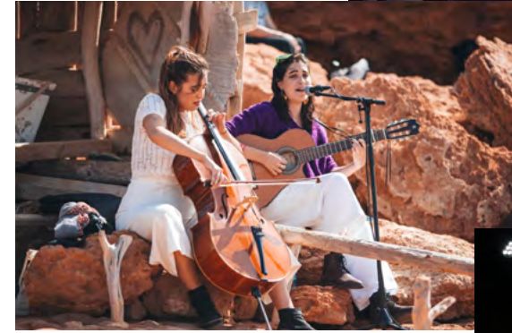
SON ESTRELLA GALICIA POSIDONIA